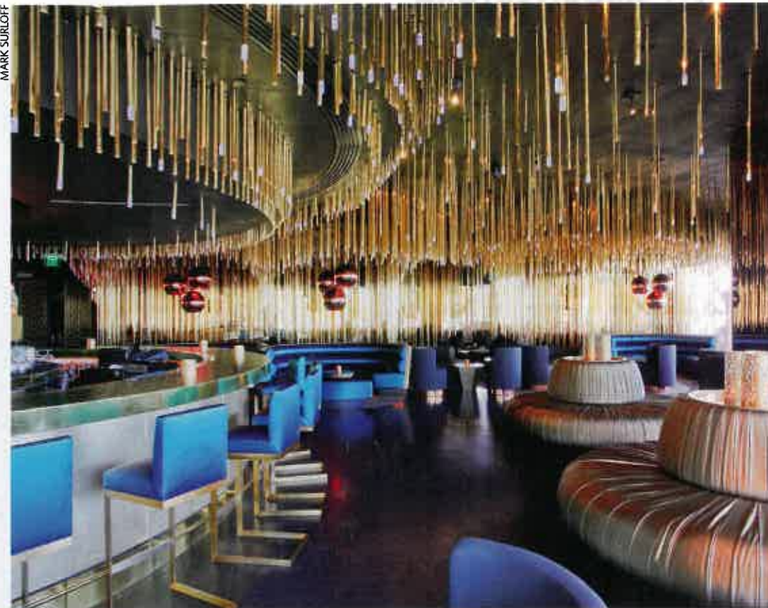
Más de 2000 lámparas LED cuelgan en el Whisky Bar del Hotel W en Fort Lauderdale, Florida. La presencia del vidrio proyecta las luces hacia el infinito como en un cielo estrellado.